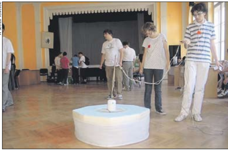
A diákok bemutatták a saját találmányaikat

A diákok négy, egyenként harminc perces próbán kellett bizonyítsanak. Elsőként az interneten fellelhető, fizikával kapcsolatos információkat kellett megkeresniük, majd egy feladat megoldásával és egy kísérlet elvégzésével folytatódott az egyéni próbák sora. Végezetül egy általános műveltségi, főleg a fizikához és Károly-József Irenaeus életéhez és munkásságához kapcsolódó tesztet kellett a versenyzőknek kitölteniük. Délután következett a verseny igencsak várt része, amikor is